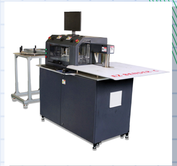
EZBENDER - C